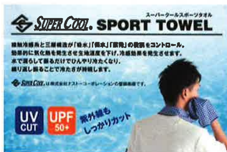
夏対策!! クールタオルシリーズ