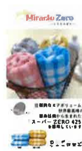
Miracle Zero ミラクルゼロ