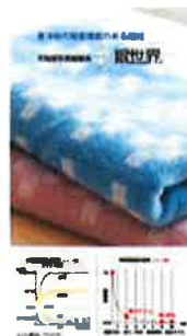
快適プラス 東洋紡銀世界