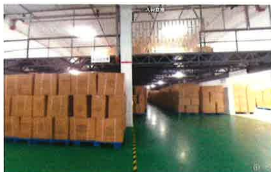
写真は、NASTEX QINGDAOの広大なストックヤード

製造納期管理からベストデリバリー方法のご提案まで、お客様にとってベストなかたちで、商品をお手元にお届けいたします