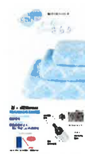
吸水速乾素材 マーメイド

抗ウイルスタオル 繊維上のウイルスや細菌を除去します (ウイルス減少率 99%以上)